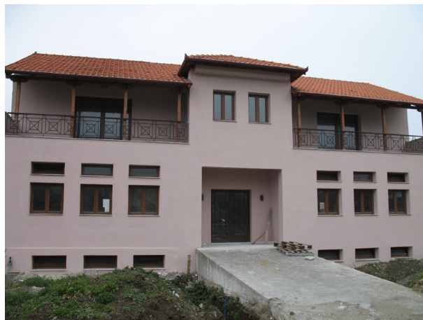
Το κτίριο στη Βεργίνα όπως είναι σήμερα

Παράλληλα, θα διευρυνθεί υπό καλύτερες προϋποθέσεις το ενημερωτικό - επιστημονικό έργο μας, σε συνεργασία με τον Δήμο Βεροίας, ελληνικά και ξένα πανεπιστημιακά ιδρύματα και συναφείς οργανισμούς, με σκοπό την αξιοποίηση της εθνικής και της διεθνούς εμπειρίας και την αξιολόγηση των περιστατικών της τοπικής προσπάθειας, που εντάσσεται πλέον στα υπάρχοντα σχετικά δίκτυα εντός και εκτός Ελλάδος.